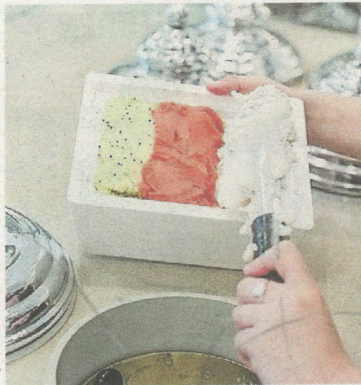
Das natürliche Eis gibt es auch in Mitnehm-Boxen.

derem mehr Aufwand. Frische Früchte wie zum Beispiel Marillen oder Ringlotten werden direkt im Geschäftslokal in der Josefstadt händisch entkernt und weiterverarbeitet. Die Milch wird unhomogenisiert verwendet, das heißt, dass sie kürzer haltbar, dafür aber gesünder ist, und auch die gelieferten Nüsse werden zum Teil selbst gerös-