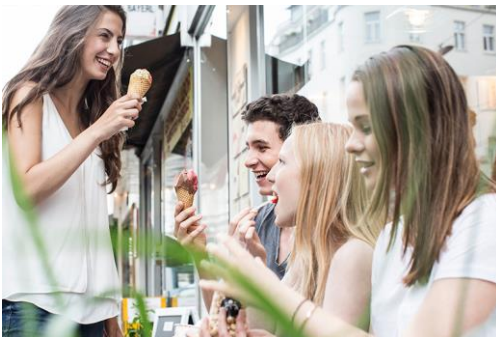
Jeden Tag ein Gelato medio genießen