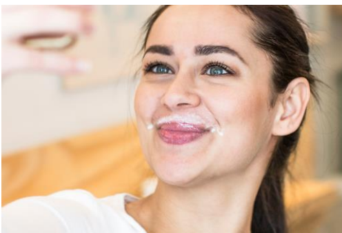
Gesucht: Wiens schönster Gelato-Bart